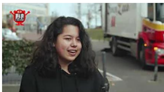
Debat op Straat: Is vrijheid belangrijker dan gezondheid