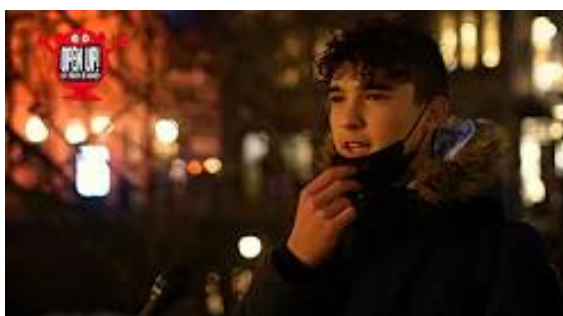
Debat op Straat: Moeten de scholen sluiten?