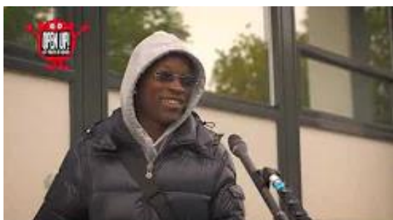
Debat op Straat: Moeten alle 18 jarige 10.000 euro krijgen?