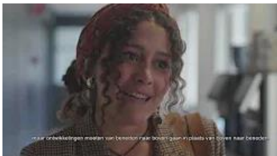
Verandering moet vanuit de mensen zelf komen. over wat er online gebeurt?