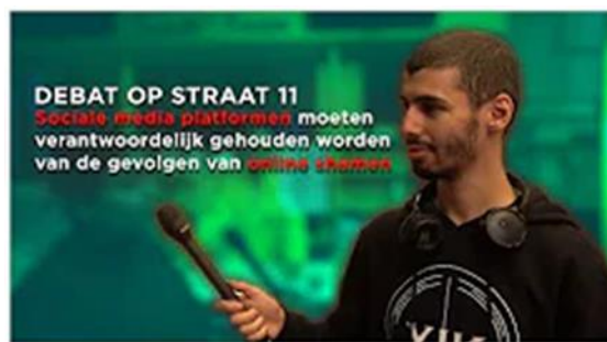
Moeten platformen de verantwoordelijkheid krijgen