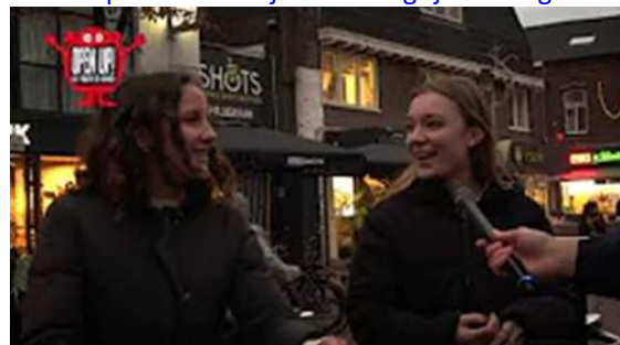
Debat op Straat: Zijn de nieuwe maatregelen een goed idee?