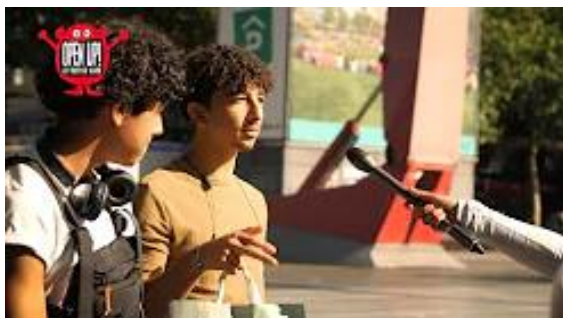
Debat op Straat: Krijgen jongeren te vaak de schuld?