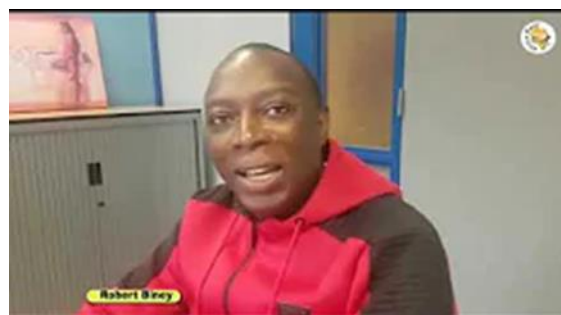
Mfantsiman en Open Up