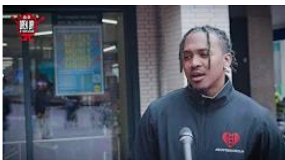
Hebben jongeren impact gehad op de verkiezingen?